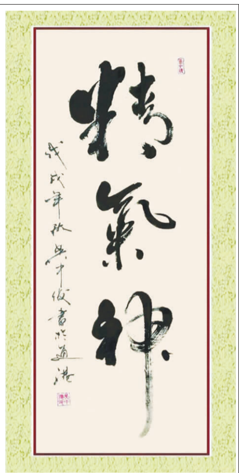
书法作品一帧 吴中俊/书

我,为自己是一个通港集箱人而自豪,因为我见证了20多年来风雨沧桑,巨龙腾飞的过程。凡是过往,皆为序章!今后的日子里,作为一名伴随改革开放成长的港口一员,我,还将继续守卫,因为我坚信,在新时期深化改革的进程中,南通通海集装箱港区将与规划中的通州湾港区,以及沿江沿海的其他港口,一起组成南通江海联运的枢纽,成为江苏出海新通道和江海联动新引擎,为新时代的南通港创造新的辉煌,见证新的奇迹。