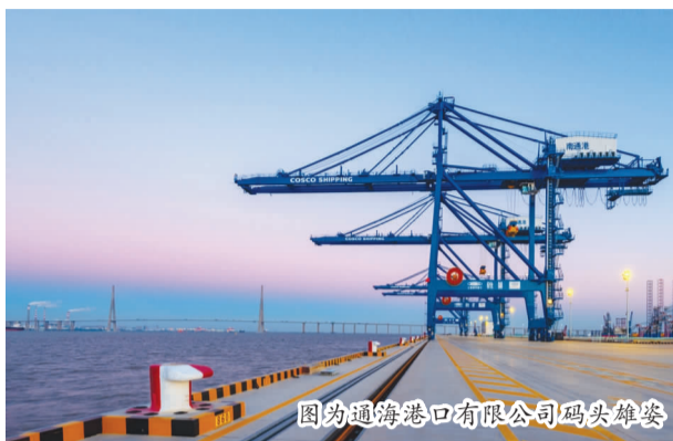
图为通海港口有限公司码头雄姿